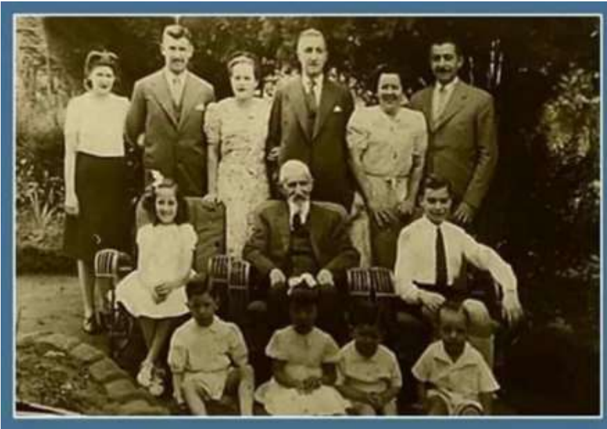
EN SU CASA PATERNA EN PERGAMINO JUNTO A HERMANOS Y SOBRINOS, EL SENTADO AL MEDIO JUSTO DEBAJO DE ÉL ES SU PADRE

Las fuerzas políticas que participaron en la elección de acuerdo con la cantidad de votos conformaban un Colegio Electoral que luego por votación aclamaban al presidente. La idea era lograr lo que modernamente decimos “governabilidad” porque los electores de todas las fuerzas que participaron buscaban allí consensos y eso servía luego para el equilibrio del poder y la búsqueda de acuerdos. Explico esto, porque puede aparecer otra vez el “historiador del poder” para decir que Illia tuvo pocos votos y era un presidente débil. Eso es agarrar una superficialidad, con parte de la verdad y buscar degradar la imagen de este gran Presidente que es preferible ocultar. No vaya a ser que alguien se avive como se debe ser en política.